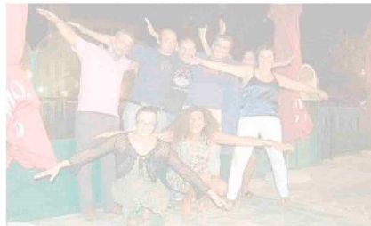
Teatro sociale. La compagnia Aerea con «Monologhi al femminile» di Fo e Rame al Teatro dell'Attrito di Porto Maurizio

«Rock in the Casbah» in collaborazione con Alex Cosentino de La Moscabianca.