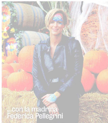
...con la madrina Federica Pellegrini

DIVERTIMENTO SPETTRALE Sopra, Gardaland nella sua versione spettrale dedicata ad Halloween, tra show con mostri, streghe e vampiri, per tutti i weekend di ottobre fino all'1 novembre. A sin., Federica Pellegrini, 28 anni, al parco divertimenti di Peschiera del Garda (Vr) in veste di madrina per Halloween: la campionessa ama molto le montagne russe.