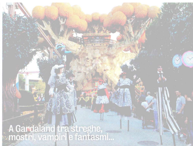
A Gardaland tra streghe, mostri, vampiri e fantasmi...

La festa di Halloween che si celebra la notte del 31 ottobre è una festa rilanciata tempo fa (l'origine è precristiana) negli Stati Uniti e che ha contagiato anche la Vecchia Europa. Una festa che ormai si prolunga per quasi un mese. Nel parco ravennate di Mirabilandia ( www.mirabilandia.it ), mostruose creature e zombie pronti a inseguire gli ospiti che si avventureranno nella Horror Zone o nei 4 spettrali tunnel dell'orrore. Grande novità Malaboglia, tunnel ispirato all'Inferno dantesco. Gardaland Magic Halloween ( www.gardaland.it ) regala scompiglio, divertimento e brividi agli ospiti che varcano le soglie del parco divertimenti tutti i weekend del mese, fino al ponte di Ognissanti. Il 31 ottobre c'è il Gardaland ►►