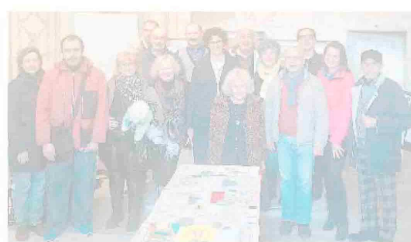
Un momento dell'inaugurazione della mostra di bozzetti