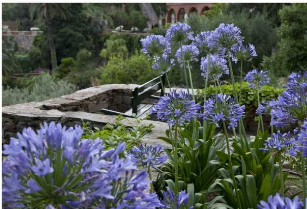
Gli agapanthus sono fiori di origine sudafricana, per questo chiamati anche "gigli africani"

DOVE Liguria: agapanti e loti a Villa della Pergola 4/11