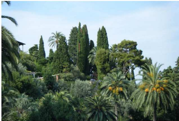
Piante mediterranee e da ogni parte del mondo convivono nei giardini di Villa della Pergola