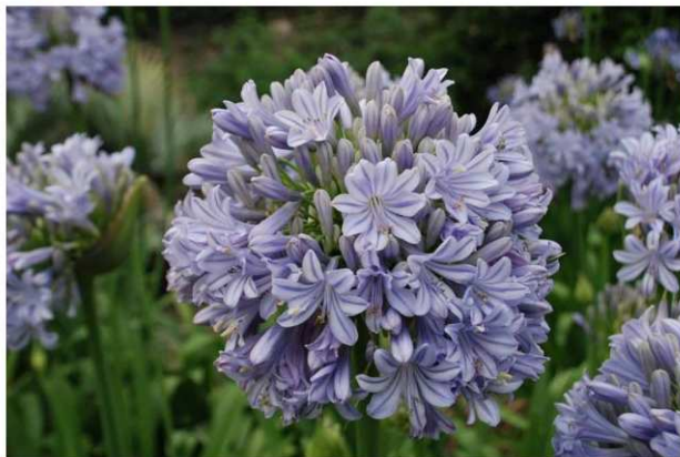
Blu o azzurri con sfumature viola: questi i colori degli agapanti, di cui Villa della Pergola vanta ben 350 varietà

DOVE Liguria: agapanti e loti a Villa della Pergola 5/11