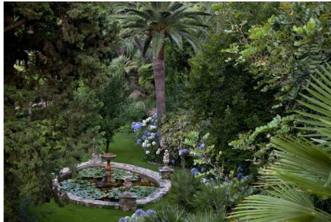
Un parco di 22.000 metri quadri che conserva le sue caratteristiche di giardino all'inglese ottocentesco