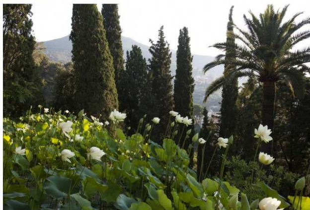
I loti nei giardini di Villa della Pergola

DOVE Liguria: agapanti e loti a Villa della Pergola 6/11