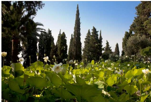
I loti come gli agapanti, le ninfee e le ortensie fioriscono in estate