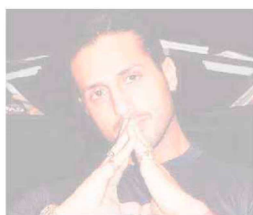
Corona al Bay

Alle Vele di Alassio stasera è in programma «Yuppies Sunday» con la voce di Ivana Spagna