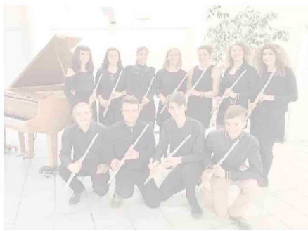
Foto di gruppo per i Giovani Flauti dell'Accademia finalese