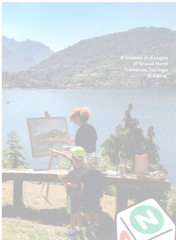
A lezione di disegno al Grand Hotel Tremezzo, sul lago di Como.

anticacortepallavicinarelais.it. PREZZI: doppia con lettino (gratuito sino ai 5 anni) da 240 euro, prima colazione inclusa.