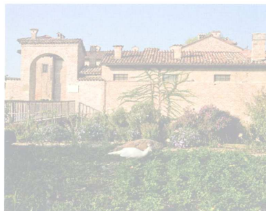
L'Antica Corte Pallavicina vicino a Parma.

A Villa della Pergola è possibile soggiornare nelle dodici suite di charme, fare una tappa golosa nel nuovo ristorante Nove e andare alla scoperta del grande parco all'inglese che unisce vegetazione mediterranea e