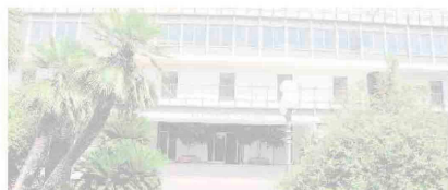
Alle 21 al Palaparcos di Bordighera va in scena «Candido»