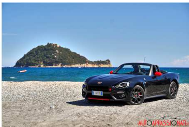
Abarth 124 Spider - Isola di Gallinara

Albenga conserva l'impianto basato sul castro romano e merita la vista del suo centro storico monumentale, tra i più ricchi di opere e palazzi storici. Tra i principali vi segnaliamo la Cattedrale, il Battistero, Palazzo Vecchio del Comune e il palazzo Vescovile con il museo diocesano che raccoglie il Tesoro della Cattedrale.