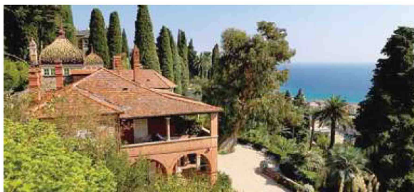
I Giardini di Villa Pergola ad Alassio