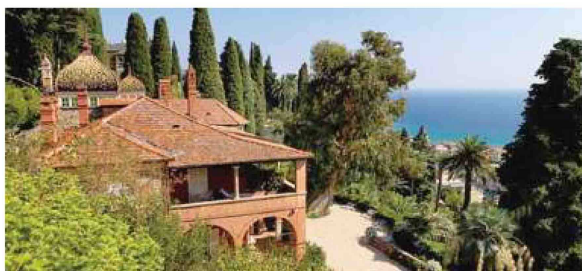
I Giardini di Villa Pergola ad Alassio