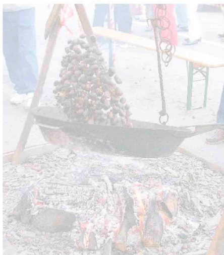
A Montegrosso Pian Latte la 49ª festa della castagna

Sassello «Giochiamo a... proteggerci dai disastri naturali», laboratorio didattico per bambini con le guide del Parco del Beigua: l'appuntamento è al Centro visite di Palazzo Gervino (ore 16).