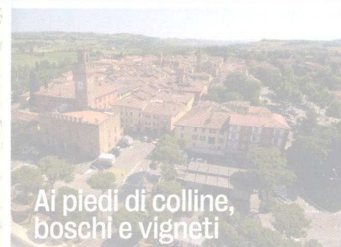
Ai piedi di colline, boschi e vigneti