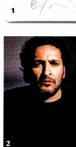
1. Un dittico a soggetto floreale, realizzato con una macchina istantanea di nuova generazione Fuji Instax, da Maurizio Galimberti (2). 3. Uno scorcio del giardino di Villa della Pergola ad Allassio (Sv), con la collezione di agapanti.