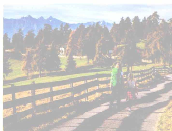
La passeggiata rigenerante tra i larici a San Genesio (Bz).

Un festival alla scoperta di tradizioni, canti, balli e musiche dei popoli indigeni. Come la cultura delle tribù dei Tufi della Papua Nuova Guinea, gli usi dei Cherokee, gli indiani del Nord America, e dei Chukchi - Eschimo che vivono ai confini dell'Alaska. Succede a Chiuduno (Bg), fino al 10 giugno, in occasione di Lo spirito del pianeta. Tra gli ospiti attesi, Ndikela Mandela, responsabile della fondazione Mandela che promuove l'istruzione e la sanità in Sudafrica. www.lospiritedelpianeta.it