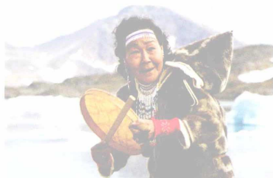
Un'eschimese Inuit, ospite del festival Lo spirito del pianeta.